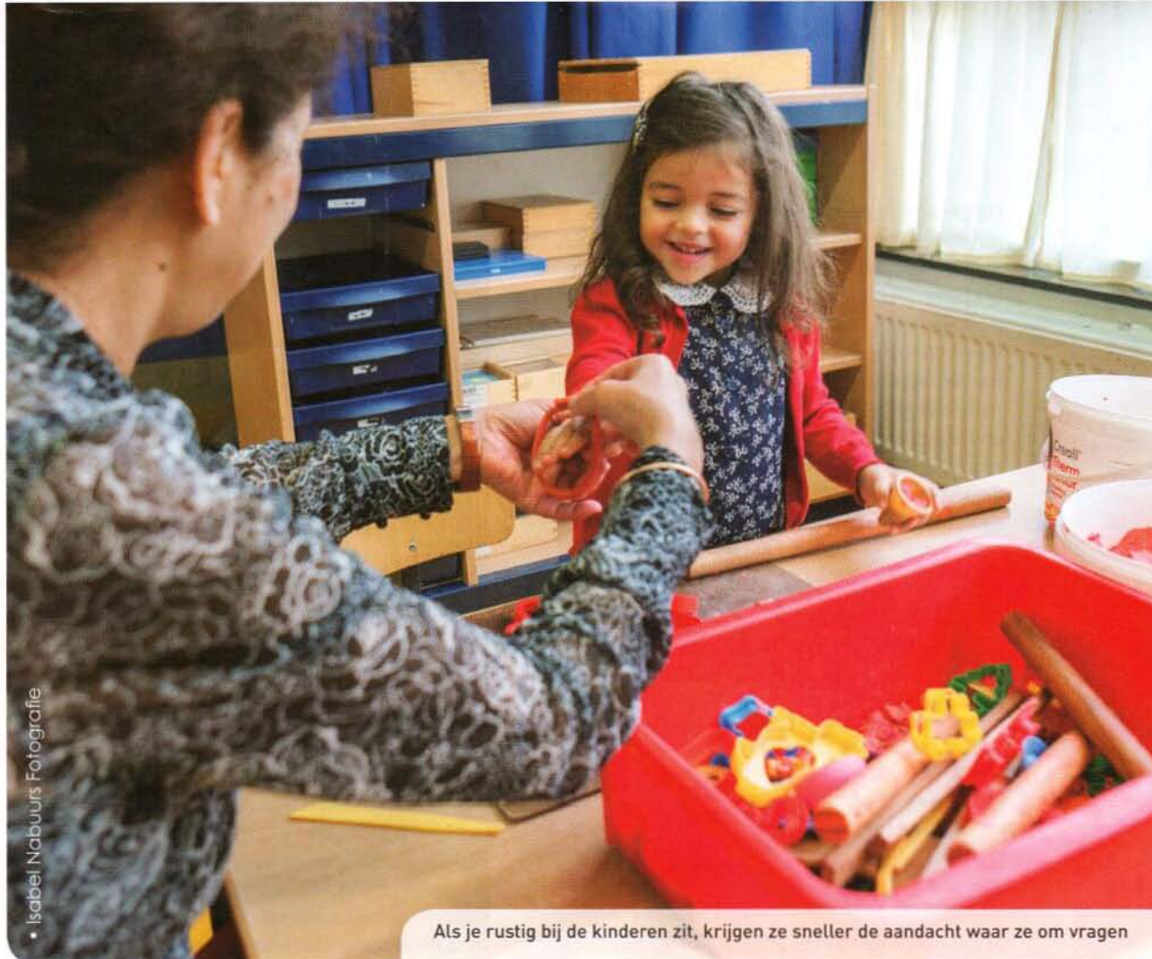
• Isabel Nabuurs Fotografie

Als je rustig bij de kinderen zit, krijgen ze sneller de aandacht waar ze om vragen